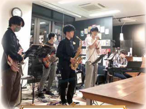
帯広畜産大学ジャズ研究会