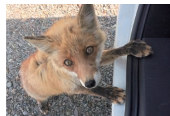
何かください… “Can I have some food, please?”

現 時点では、エキノコックス症のリスク回避や農作物被害を減らすために、ある程度の駆除は必要だと思われます。ただ、必要以上にその個体数を減らすことが無いように、この美しく、愛らしい北海道土着の動物との共存を考えてゆくべきだと思います。