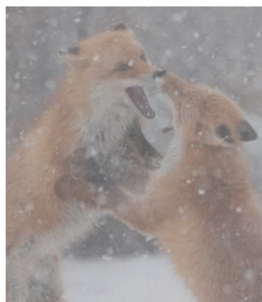
雪の中のペア A pair of red foxes in the snow

They used to be treated as a fur-bearing animal, due to the superior quality of their fur, and were relentlessly hunted. However, they are now regarded as vermin to be exterminated, because they eat sweet corn and beets, causing damage to crops and mediating echinococcosis (a zoonosis). In the city of Obihiro, for example, roughly 200 red foxes were exterminated every year from 2016 to 2019, with the exact number ranging from 191 to 278.