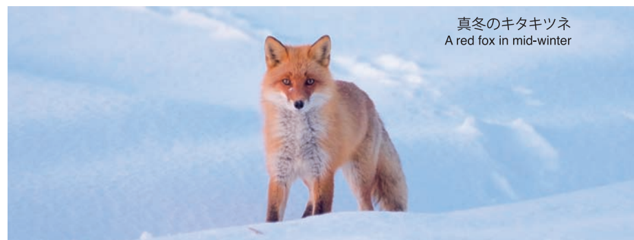
真冬のキタキツネ A red fox in mid-winter

A t present, some extermination may be necessary to reduce the risk of echinococcosis and agricultural damage. However, the key is to seek the beneficial coexistence of humans and such beautiful and attractive animals, native to Hokkaido, without reducing their population more than necessary.