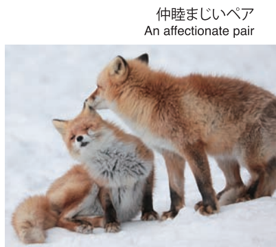
仲睦まじいペア An affectionate pair