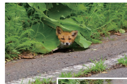
道路沿いで餌を待つ キタキツネ A red fox waiting for food at the roadside

However, red foxes are very cute and can be spotted up close. They have, in fact, become the symbol of Hokkaido tourism, and are sometimes fed by tourists. Many red foxes beg for food at the roadside, and as a result often die in traffic accidents.