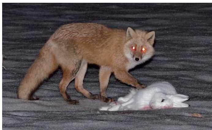
ユキウサギをしとめたキタキツネ A red fox and its prey, a mountain hare

U nfortunately, only the downside of red foxes, such as their role as agricultural vermin or echinococcosis mediators, tends to be emphasized. But—and this is a big but—is this emphasis just? They have, for example, an important ecological role as a predator of small animals such as rats and rabbits. In fact, in areas where red foxes have been exterminated, the resulting increase in the number of such small animals causes significant agricultural and forestry damage.