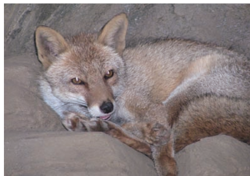
ホンドギツネ A hondogitsune : V. v. japonica

キタキツネは良質の毛皮を有するため、かつては毛皮獣として多く狩猟されていました。現在はスイートコーンやビートなどを食害する農業害獣として、または人獣共通感染症であるエキノコックス症の媒介者として有害鳥獣駆除の対象です。帯広市では2016～2019年にかけて、最も多い年で278頭、少ない年で191頭と、毎年200頭前後のキタキツネが駆除されています。