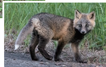
色違いの子供 A cub with unusual coloration

一方でその愛らしい姿や、身近に見ることができるために、北海道観光のシンボルとされる動物でもあります。観光客による餌付けは現在でも多くの場所で行われています。道路沿いで餌をねだるキタキツネも多く、そのためキタキツネの交通事故死が多発しています。