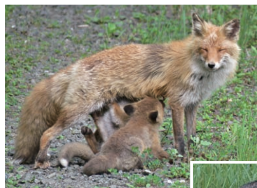
母親の乳を飲む子供たち Suckling cubs