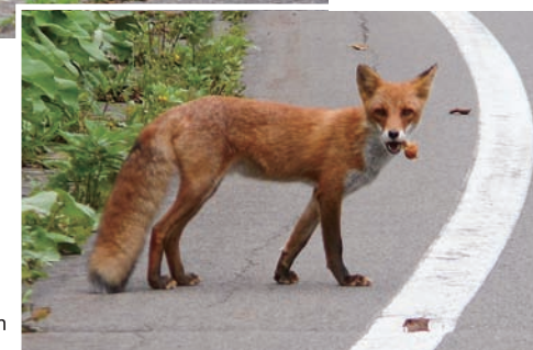
フライドチキンを もらったキタキツネ A red fox with a piece of fried chicken in its mouth

キタキツネは自然の資源だけでなく、人間の生産物も利用して生きていくことの出来る適応力の高い動物です。十勝地方での自動撮影カメラを用いた調査でも、特に餌の乏しい冬期には、森林などの自然環境よりも市街地や農耕地でより多く確認されています。