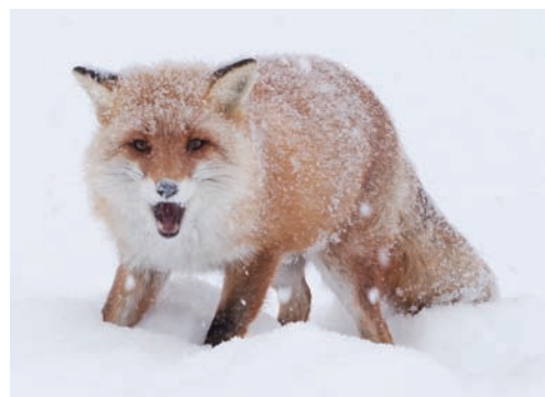
キタキツネ A kitakitsune : Vulpes vulpes schrencki

In Ainu, a kitakitsune (red fox, Vulpes vulpes schrencki ) is usually called a cironnup (beast or prey); and in some areas, a sumari or kimotpe . Red foxes adapt to diverse environments and live in a wide range of areas, including urban centers, agricultural land, forests, and mountains, throughout Hokkaido, Japan. They differ from a hondogitsune ( Vulpes vulpes japonica ), which live in the southern part of Japan, including Honshu, the main island of Japan, at the subspecies level.