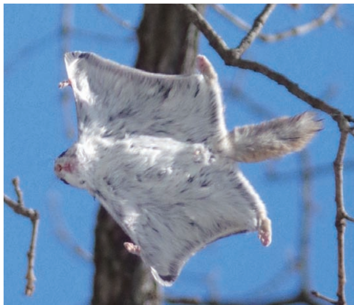
滑空するモモンガ A flying squirrel in mid-glide

大 学構内のエゾモモンガは私たちが調査を始めた30年前と比べて、現時点でも大きく減っていないと思います。ただし、彼らが生活する林地は少しずつ面積を減らしていていますし、彼らが移動に使う並木も切られています。