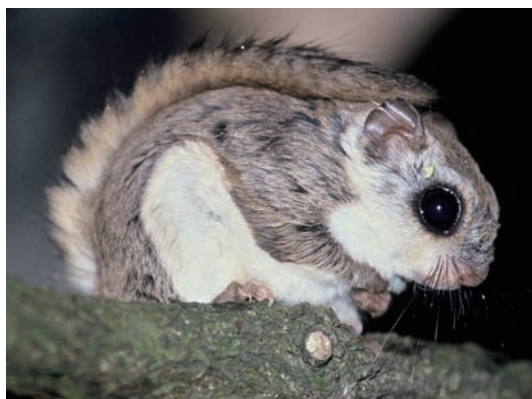
夏毛のモモンガ A flying squirrel with summer pelage

M any flying squirrels live on the campus of Obihiro University of Agriculture and Veterinary Medicine. Although we seldom see them because they are nocturnal, they actually live very close to us. Flying squirrels do not hibernate, but are active throughout the year.