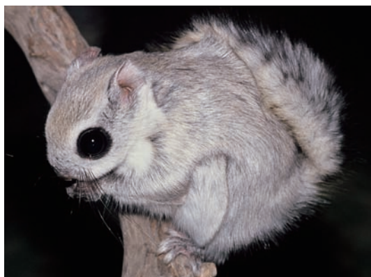
冬毛のモモンガ A flying squirrel with winter pelage