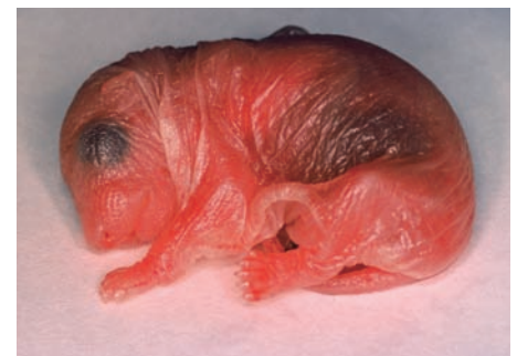
出生当日の赤裸なモモンガ A hairless flying squirrel on the day of birth

F lying squirrels give birth once or twice a year, with two to six pups in one delivery. Pups usually open their eyes at 35 days after birth, and then leave the nest at around 60 days. They start practicing gliding about 50 days after birth.