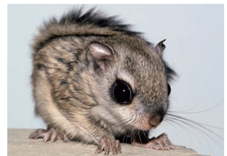
生後約60日のモモンガ A flying squirrel at about 60 days after birth