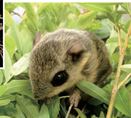
ヤナギの葉を食べるモモンガ A flying squirrel eating willow leaves