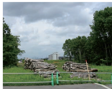
伐採により分断された林 A forest fragmented by deforestation

A crossing structure has been installed at the southwest end of the campus, to make it easier for the squirrels to transit between the forests bisected by the freeway. Monitoring revealed that the squirrels used the structure to cross; thus, we may need to install more such structures to protect them.