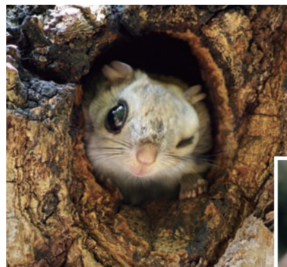
樹洞から顔を出すモモンガ A flying squirrel peeking out from a tree cavity

F lying squirrels typically nest in natural tree cavities or old woodpeckers' nests. Nest boxes with entrance holes of 3-4 cm in diameter are also often used; however, they are not used in winter due to poor heat retention.