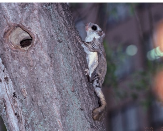
巣に戻ってきたモモンガ。 後ろの建物は3号館 A flying squirrel having returned to the nest. The building behind is the General Research Building III.

M any flying squirrels live on the university campus. We put up 149 nest boxes in and around the campus, and observed the nest boxes for three months from August to October. We counted a total of 91 individuals, including 24 juveniles born in the year.