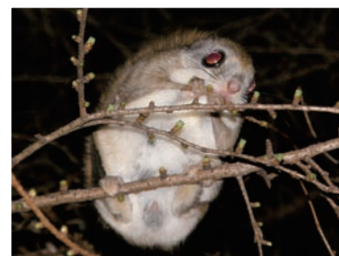
カラマツの芽を食べるモモンガ A flying squirrel eating larch leaf buds

F lying squirrels are largely plant eaters, feeding mainly on tree leaves and leaf buds; whereas, red squirrels feed chiefly on walnut seeds and pine seeds. Therefore, there is little overlap in the food resources of the two species.