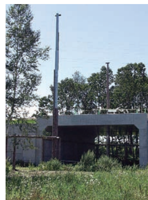
モモンガ用の道路横断構造物 A road-crossing structure for flying squirrels