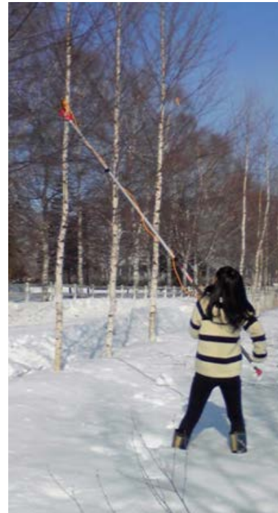
-20°C以下で生存する樹木