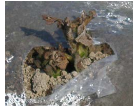
霜害を受けたジャガイモ(長崎)