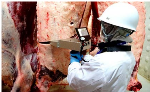
ミート・イメージジャパンと開発中の撮影装置