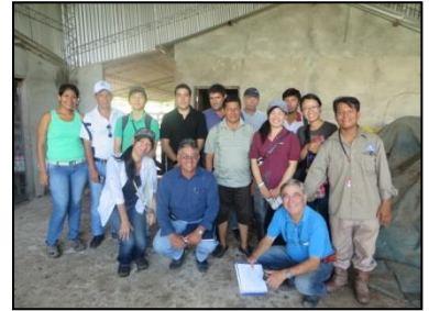
研修参加者や関係者と

研修は理論的で実践的な実に高度なものでした。いただいた資料は実によい水準のものです。様々な農家、集乳所、工場への訪問では、乳生産、収集、運送、機械化、牛の品種や飼料に関する知識を得ることができました。これらは小規模酪農家にも十分に適用できるでしょう。講師、技師、農家との交流は研修をより充実したものにしてくれたことはいまでもありません。