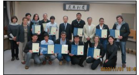
研修参加者や関係者と

日本滞在中、日本の文化、人、仕事をする姿勢について見聞を広めました。酪農生産の改善に焦点が当てられた本研修では、酪農における人工授精の利点、育成管理、衛生管理、飼料管理、サイレージの作製方法、乳房炎のような疾病を避けるための搾乳機械の使用方法などを学びました。研修で学んだ全てのことは自国でも実践可能だと思います。